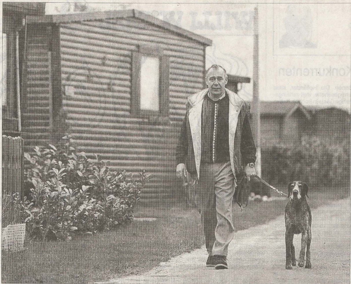
Regelmäßige Kontrollgänge mit dem Hund sollen die ungeliebten Besucher von ihren Vorhaben abhalten.